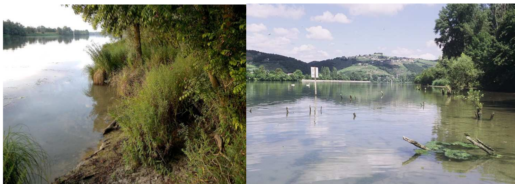
Figure 2. L'habitat larvaire de Gomphus flavipes , (a) la Saône à Peyzieu (01), (b) le site de Plaine de Gerbay sur le Rhône (38)

Ce secteur de l'île de la Platière présente un fonctionnement particulier du fait de sa situation en entrée de lône et par suite de son surcreusement et de son élargissement qui sont intervenus au début des années 1980 dans le cadre d'un projet halieutique. Il se comporte depuis ces travaux comme un « piège à sable ». Le suivi disponible depuis 1988 (PONT et al. 2004) documente bien cette accumulation progressive de sable et la dynamique de ces alluvions dont la localisation et le profil sont modifiés à chaque crue. Cette lône abrite dans ses parties à courant nul ou faible d'importants herbiers aquatiques à Vallisneria spiralis , Najas marina , Ceratophyllum demersum et, depuis quelques années, Elodea nuttallii . Son peuplement odonatologique est bien connu (PONT et al. 2004) avec comme espèces dominantes : C. s. splendens , E. lindenii , E. viridulum , P. pennipes , I. elegans , G. vulgatissimus , O. f. forcipatus , O. cancellatum et Anax imperator . On y observe plus localement Coenagrion puella (Linnaeus, 1758), Boyeria irene (Fonscolombe, 1838), Libellula fulva O.F. Müller, 1764, L. depressa , Orthetrum coerulescens (Fabricius, 1798), Crocothemis erythraea (Brullé, 1832) et Sympetrum striolatum . En 2009, la reproduction d' Oxygastra curtisii a été découverte sur cette lône.